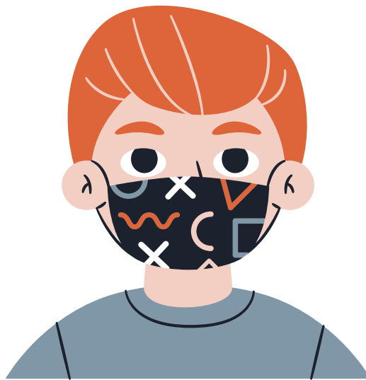
Mascaras de tela